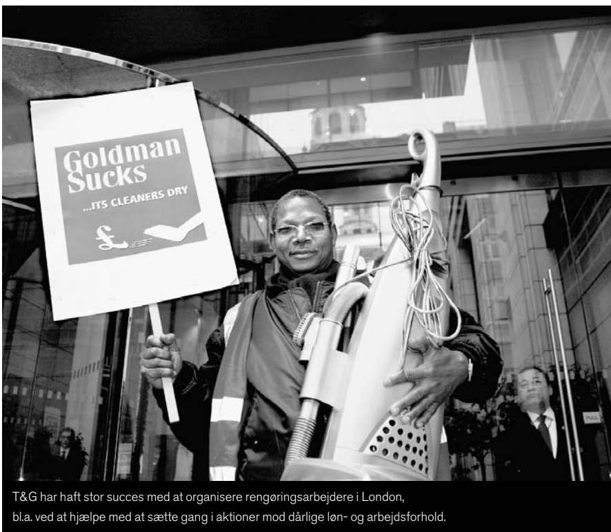
T&G har haft stor succes med at organisere rengøringsarbejdere i London, bl.a. ved at hjælpe med at sætte gang i aktioner mod dårlige løn- og arbejdsforhold.