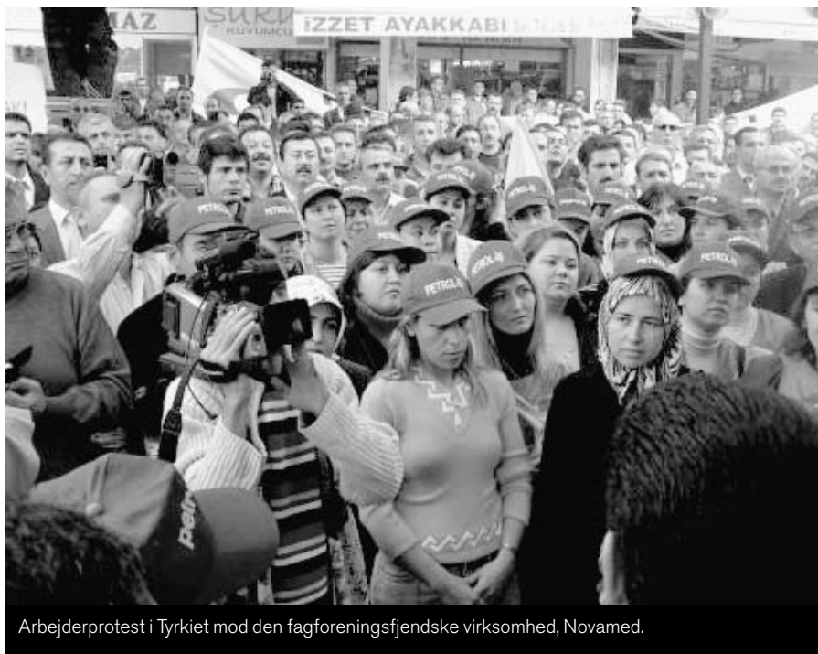
Arbejderprotest i Tyrkiet mod den fagforeningsfjendske virksomhed, Novamed.

Sidste år blev 144 fagforeningsfolk dræbt i kampen for bedre arbejdsfor-