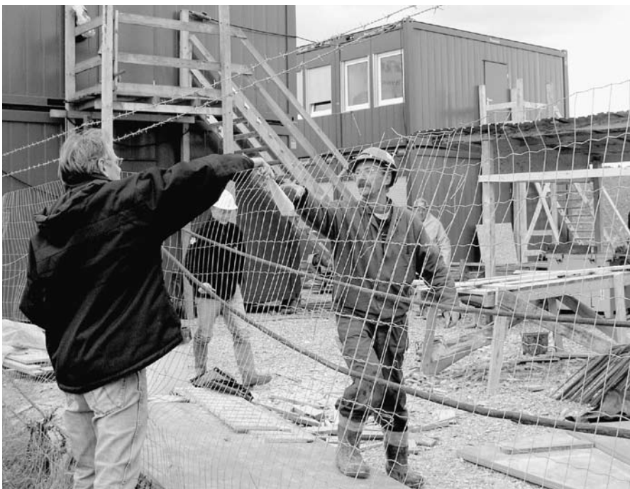
Københavnske fagforeningsaktivister ude på Nova Bau-byggeplads for at tale med de polske arbejdere.

Og det behøver ikke nødvendigvis være den nuværende tillidsmand.