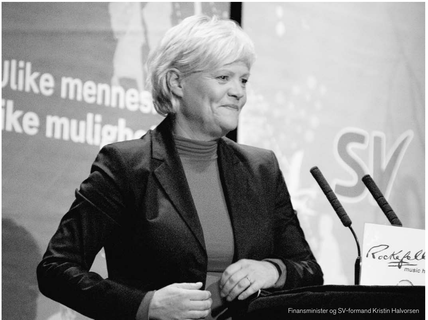
Finansminister og SV-formand Kristin Halvorsen

– På punkt efter punkt har det været klart, at for centrale dele af partiet var der ingen politisk sag, der var vigtigere end taburetterne. Og det er den visse død for et radikalt og sy-