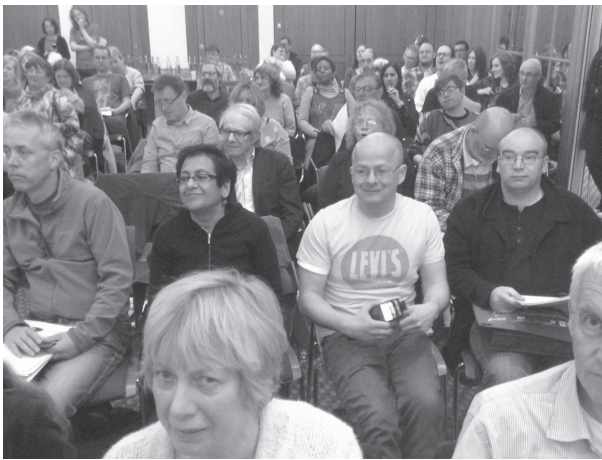
400 mennesker deltog i den stiftende konference, blandt dem filmmanden Ken Loach