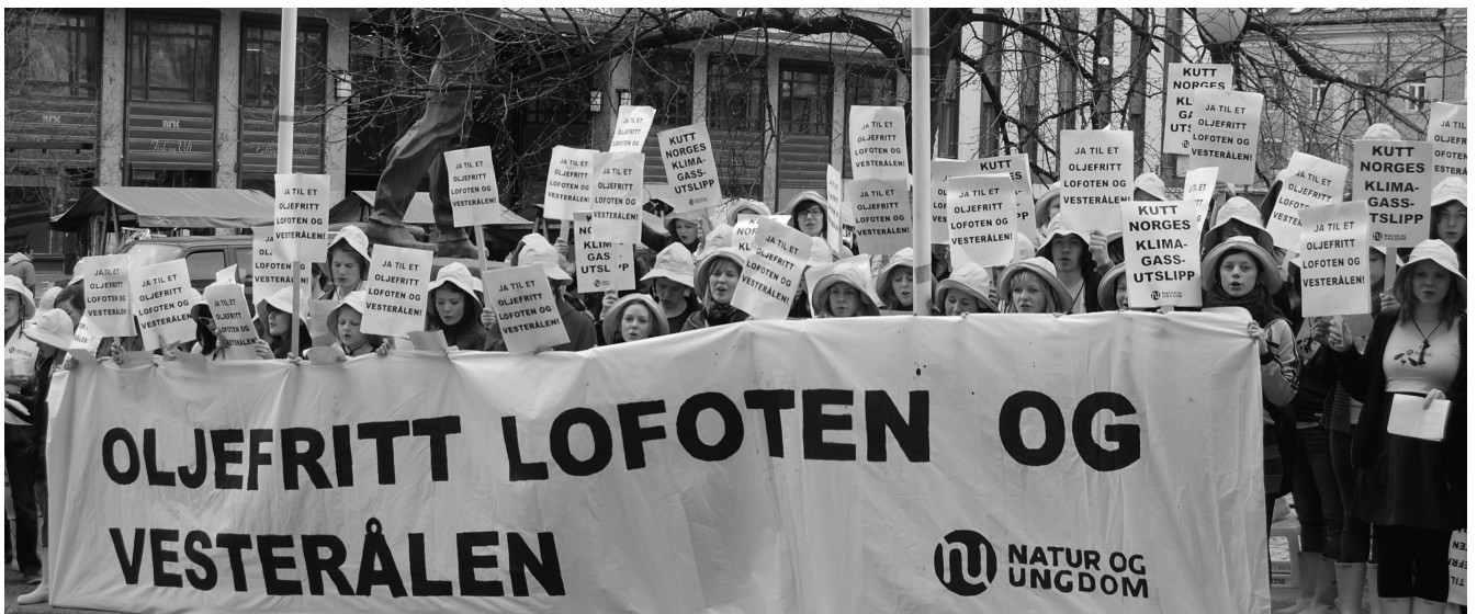
Arbeiderpartiet og regeringen har mødt en del modstand imod deres energipolitik. Her demonstrerer aktivister fra Natur og Ungdom foran Arbeiderpartiets kongres

villig til at vælte en »venstre-regering«, hvis det bliver nødvendigt. Det vil sige i en situation, hvor en sådan regering blokerer for de vigtigste krav. Ellers vil bevægelsen blive demoraliseret af »rådne kompromisser«.