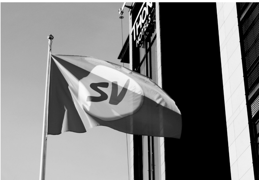
Socialistisk Venstreparti har oplevet en voldsom vælgermæssig tilbagegang efter deltagelse i Norges »rød-grønne regering«

I 2001 var Arbeiderpartiet ude for et historisk tilbageslag (note 5) med kun 24,1 procent og Socialistisk Venstreparti kom op på det højeste nogensinde med