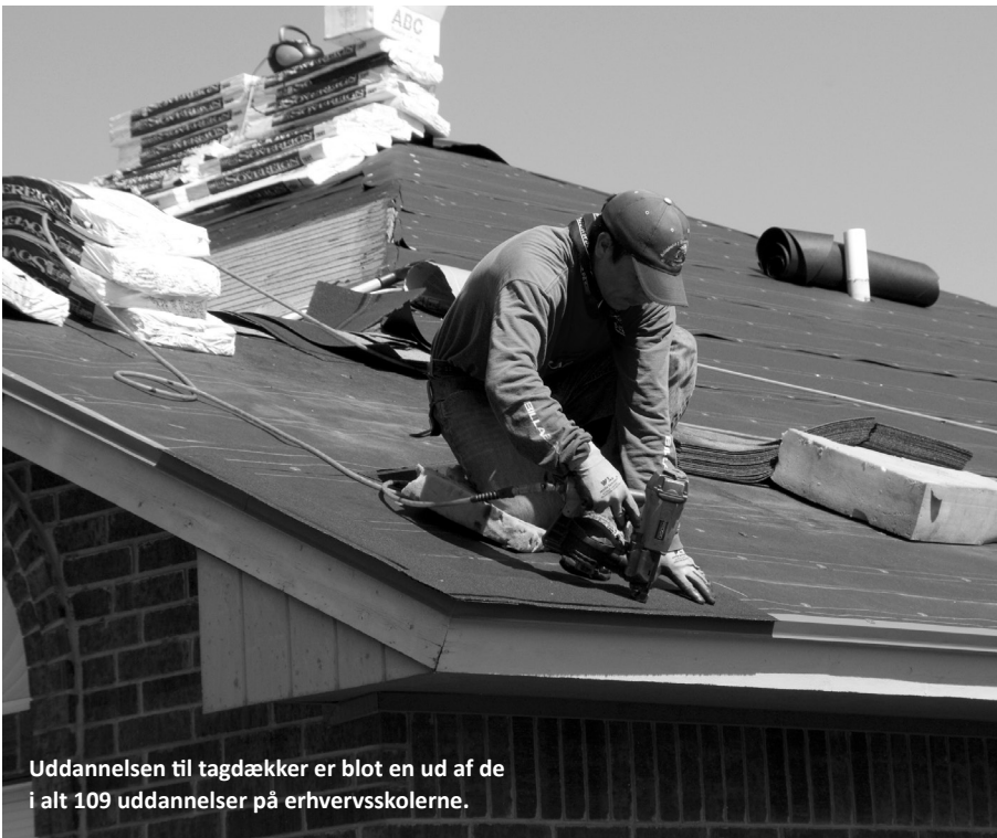
Uddannelsen til tagdækker er blot en ud af de i alt 109 uddannelser på erhvervsskolerne.

Netop denne opdeling af eleverne vil grundlæggende gøre op med en af erhvervsuddannelsernes helt store forcer, nemlig at unge som gamle deler klasselokale, og udnytter hinandens styrker og forskellige erfaringer. Især har vi tidligere