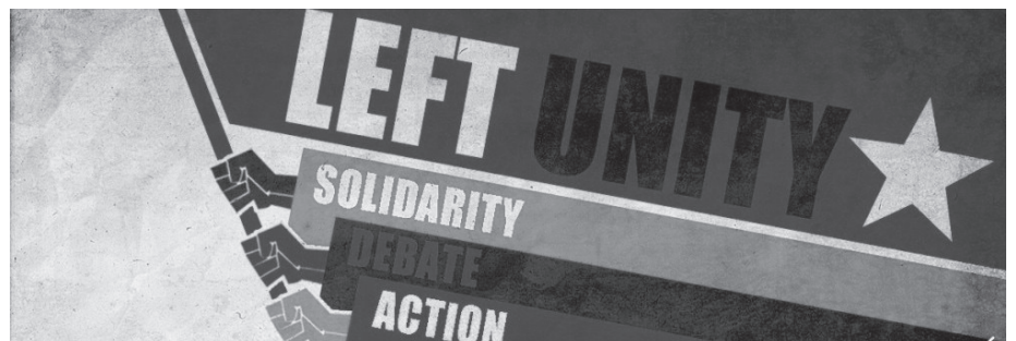
Left Unity har allerede registreret 1200 medlemmer, der får nok at se til ved de kommende lokalvalg i maj 2014 og parlamentsvalget i 2015.

vil straffe de Konservative, og det bliver svært at vinde en stor målgruppe for et nyt venstrefløjsparti. Men der er et publikum for et sådant parti. Mange mennesker vil stemme Labour uden stor entusiasme og ønsker et parti, der er udtryk for noget bedre, anderledes, mere radikalt og socialistisk. Nu er Left Unity der for dem