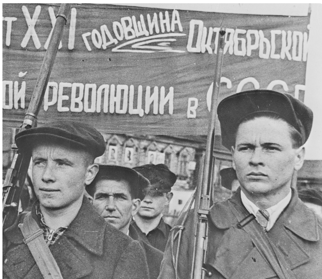
Oktoberrevolutionen. I 1930'erne fejrede man stadig revolutionen, selv om Stalins styre havde betydet voldsomme forandringer f.eks. afskaffelse af sovjetsystemet.

Hvor langsom en sådan organiseringsproces foregår, så vi tydeligt efter krisen på børsen i 1929, hvor det tog frem til udbruddet af Anden Verdenskrig, før den amerikanske arbejderbevægelse var parat til at slå igen.