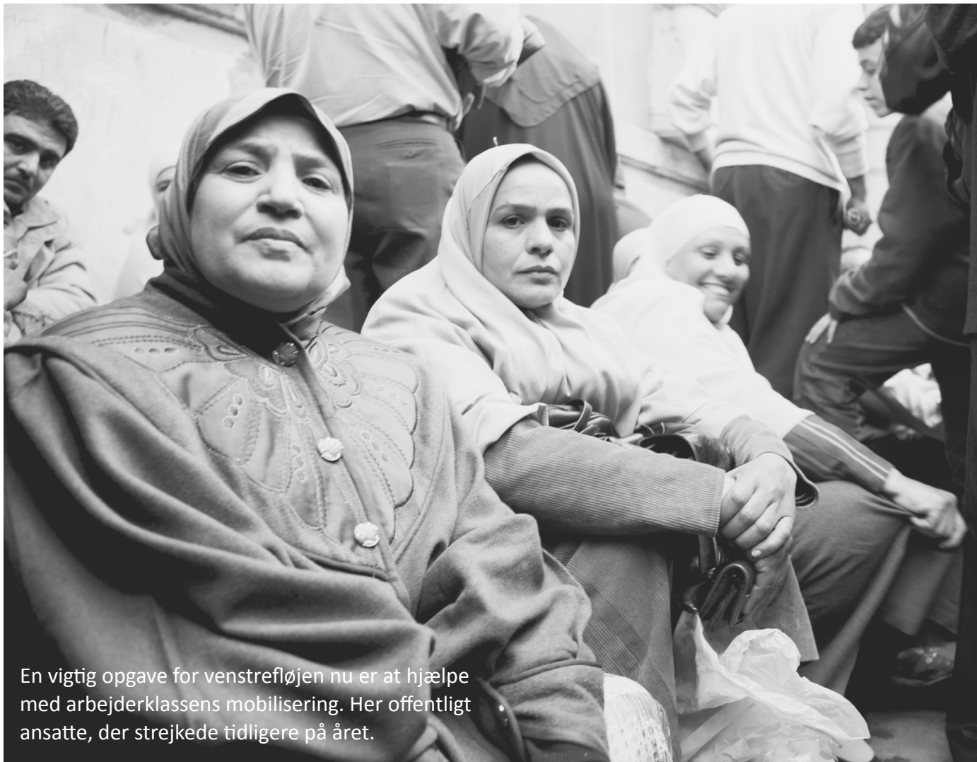
En vigtig opgave for venstrefløjen nu er at hjælpe med arbejderklassens mobilisering. Her offentligt ansatte, der strejkede tidligere på året.

»Hele ideen med den Folkelige Alliance« er at skabe et parti for venstrefløjen,« siger Fe-kry. Trods store bestræbelser på at nå dette, støttede de andre partier ikke ideen om en sammenslutning, forklarer han. »Så vi blev enige om at danne en organisering, hvor vi kan koordinere og arbejde sammen.«