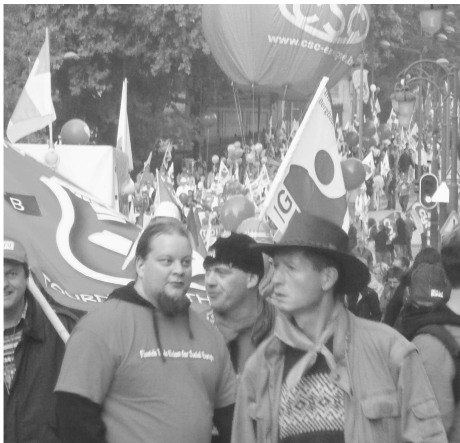
Fra den europæiske aktionsdag i Bruxelles den 29. september 2010.

En stor skyldner-styret betalingsstandsning vil åbenlyst have tilsvarende konsekvenser for bankerne, og præcis derfor er kravet om socialisering af bankerne under arbejderkontrol i både periferien og de centrale lande et naturligt supplement til betalingsstandsning for at afslutte den onde cirkel med nedskæringer, forstærket krise og redningspakker. Disse kampe må koordineres som led i en bredere