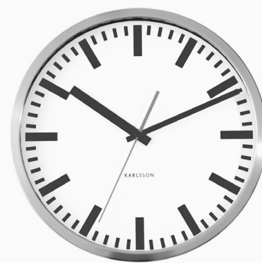
12 minutter mere om dagen er vel den mest kendte del af S og SF's plan.

Fair Løsning 2020 rummer udover den langsigtede ændring i forholdet mellem indtægter og udgifter også en omfordeling gennem dels hævnning af skatter og afgifter svarende til netto 17,7 milliarder kroner. Disse penge skal bruges til at sikre velfærd. Omfordelingen har til formål at løfte velfærdsniveauet og finansiere iværksættelse af de initiativer, som S og SF foreslår indenfor trafik, uddannelse og arbejdsmarkedspolitikken.