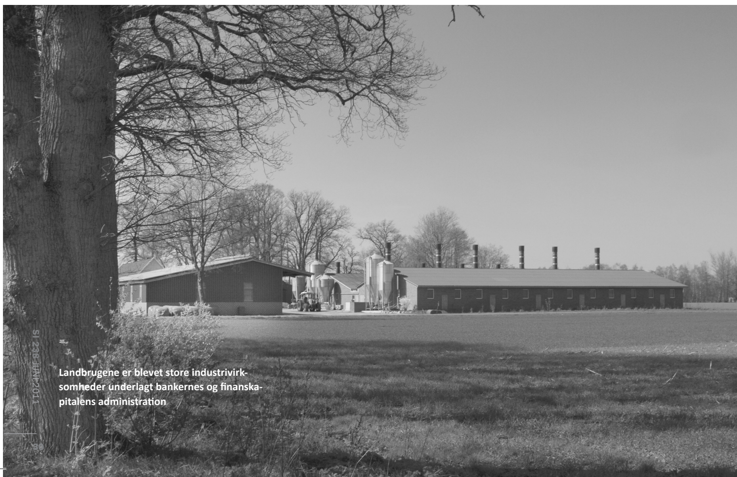
Landbrugene er blevet store industrivirksomheder underlagt bankernes og finanskapitalens administration

Derved vil en masse miljøbevidste forbrugere og mennesker fra byerne kunne deltage i en genbefolkning af landdistrikterne og genetablering af småindustri og håndværk mm. på et bæredygtigt grundlag. I sidste ende kræver denne kamp udvikling af en demokratisk og offentlig styret samfunds- og landbrugsøkonomi. Derved kan der igen udlægges offentlige opgaver, uddannelsesinstitutioner, kulturtilbud, busdrift, samt reel offentlig produktion i landdistrikterne.