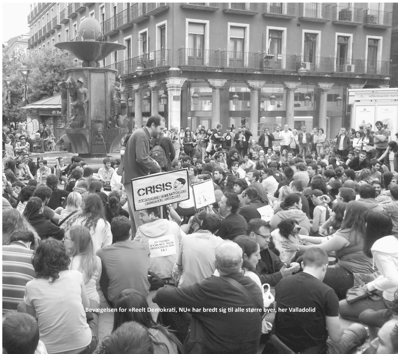
Bevægelsen for »Reelt Demokrati, NU« har bredt sig til alle større byer, her Valladolid

Men at vinde 200.000 stemmer, når PSOE tabte en og en halv million, sætter succesen alvorligt i relief. Sagt på en anden måde: IU går frem i forhold til sig selv, men ikke som en politisk pol for den alternative venstrefløj. Energien på at vinde stemmer fra 15. maj-bevægelsen, som har været anmassende og måske kontra-produktiv især i de sidste dage af kampagnen, har ikke givet gode resultater: IU har opnået resultater svarende til det resultat, meningsmålingerne forudså før valget.