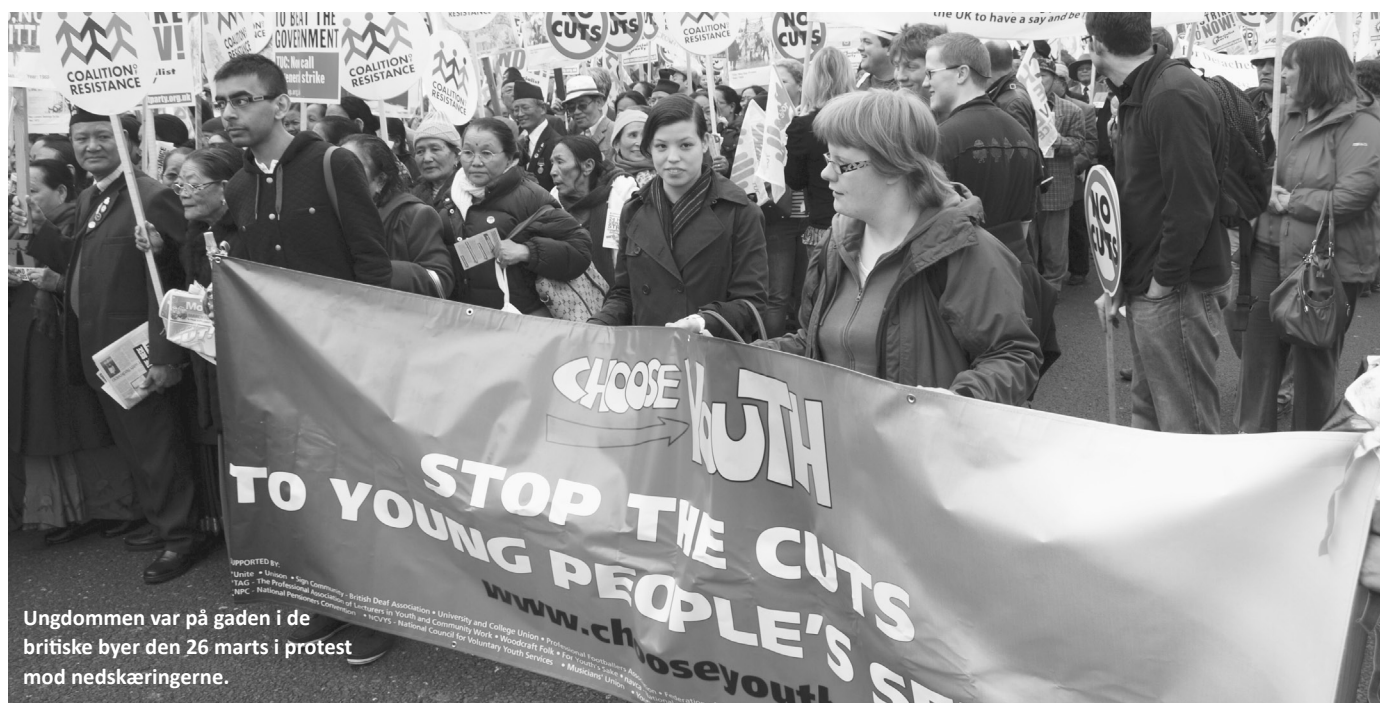
Ungdommen var på gaden i de britiske byer den 26. marts i protest mod nedskæringerne.

Nogenlunde sådan lød det enslydende fra en lang række talere. I forhold til Grækenland og Portugal og andre lande i udkanten af EU, som er truet af fallit, gik tre forslag igen: Gælden skal afskrives eller omlægges, den Europæiske Centralbank skal opkøbe statsobligationer til »tysk« rente (dvs. 3 i stedet som nu 9 procent), og der skal oprettes en Solidaritetsfond, som skal hjælpe de svageste lande med at få gang i økonomien.