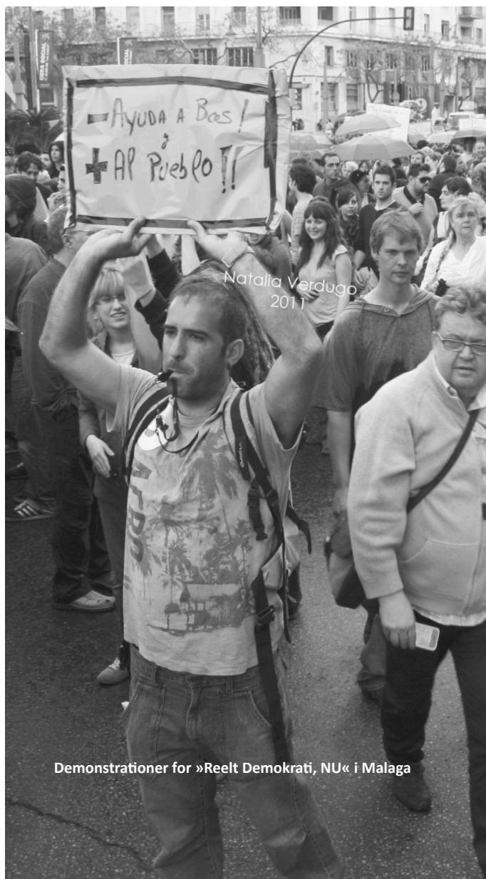
Demonstrationer for »Reelt Demokrati, NU« i Malaga