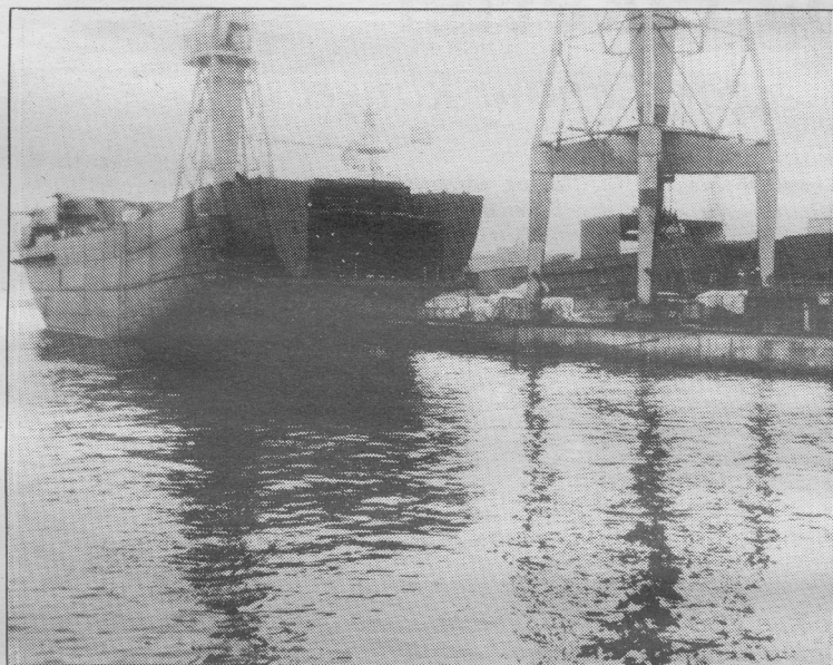
Et af skibene på Helsingør Værft til Saddam Husseins krigsmaskine.

Helsingør Værft leverer tre 'containerskibe' til Iraq