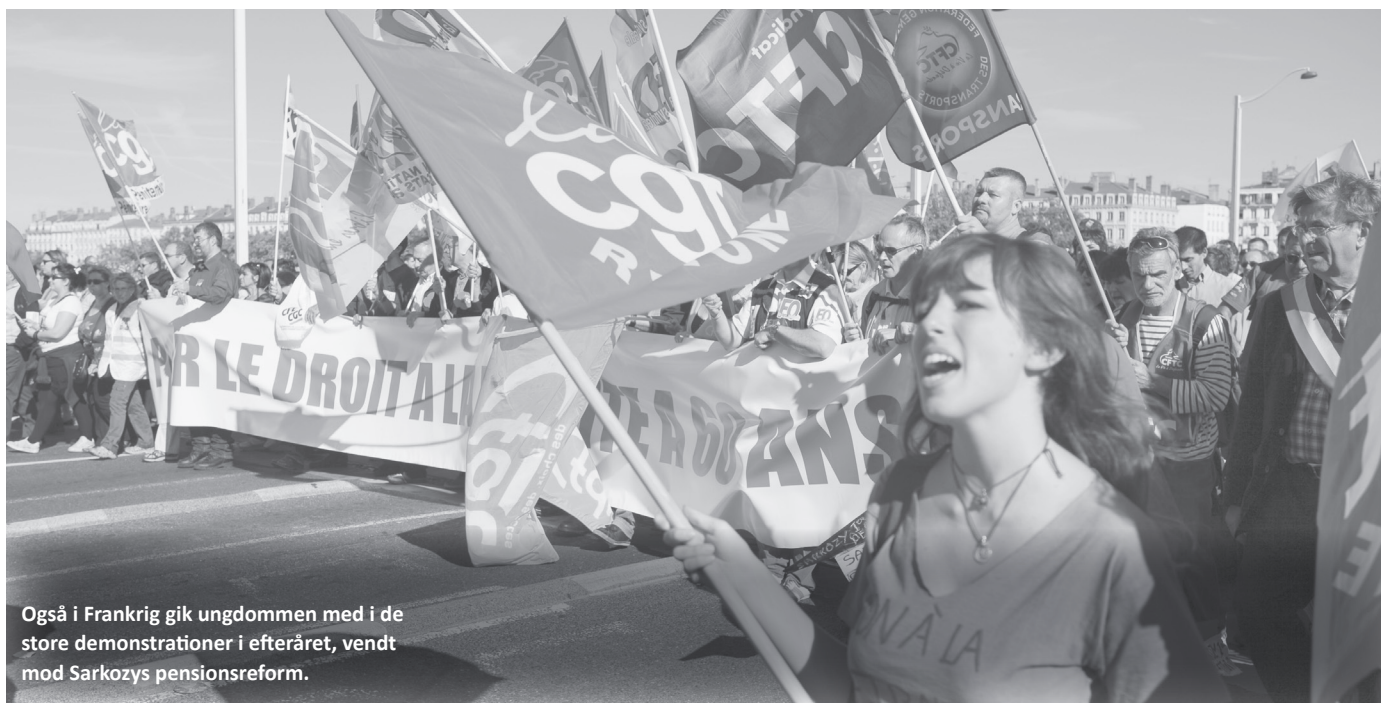
Også i Frankrig gik ungdommen med i de store demonstrationer i efteråret, vendt mod Sarkozys pensionsreform.

steder har venstrefløjspartier erstattet Socialdemokratiet som den ledende kraft i arbejderbevægelsen. Særlig slem er situationen i Spanien, Italien og Storbritannien, hvor man ikke har nogen parlamentarisk repræsentation på nationalt niveau og er splittet op i en række små partier eller grupper.