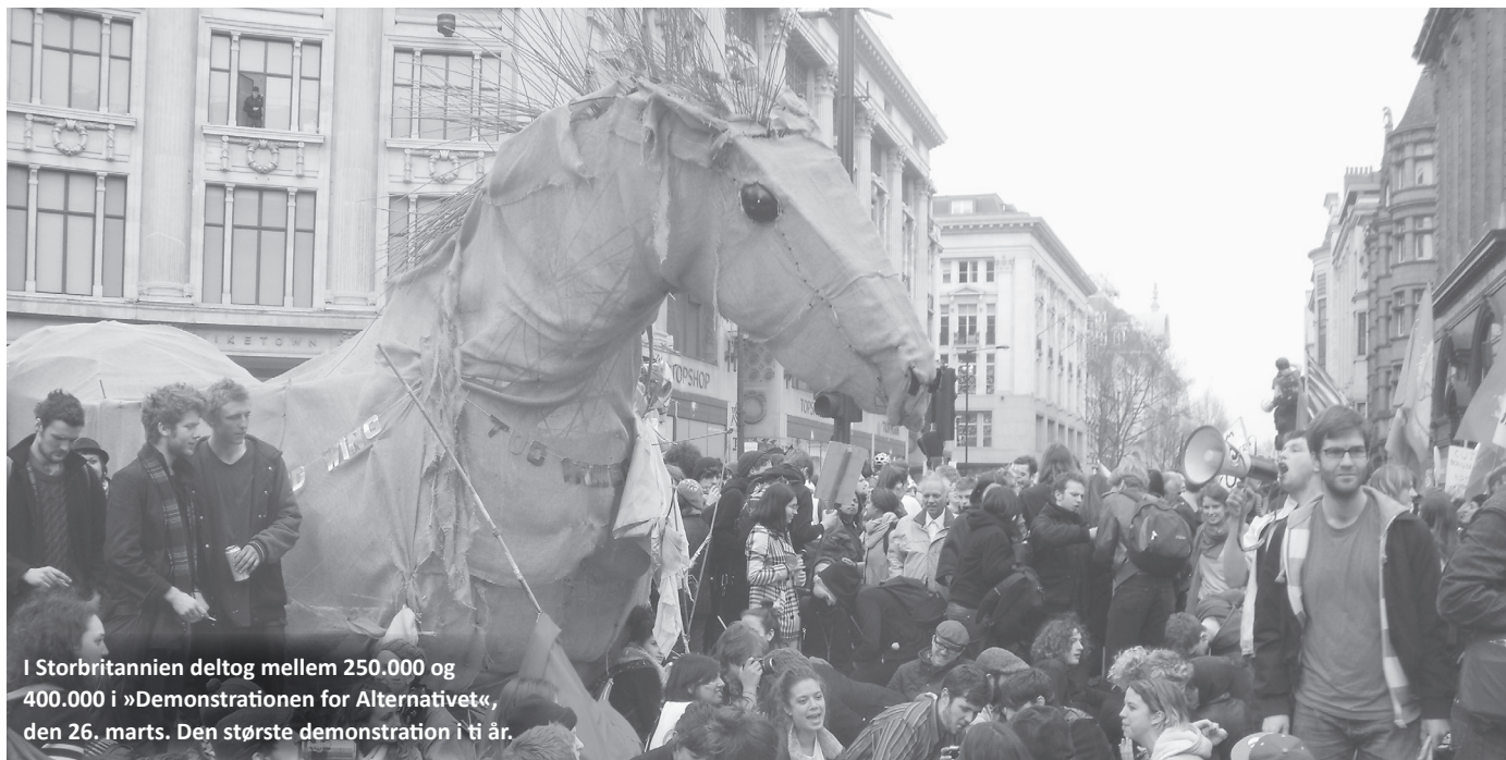
I Storbritannien deltog mellem 250.000 og 400.000 i »Demonstrationen for Alternativet«, den 26. marts. Den største demonstration i ti år.

I Tyskland har Merkel-regeringen lidt en række smertefulde nederlag i en række delstatsvalg, og store demonstrationer mod atomkraften har sat gang i en ny politisk bevægelse.