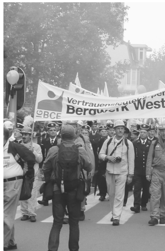
Fra den europæiske aktionsdag i Bruxelles den 29. september

Hvis et eller flere lande i periferien lykkes at gennemtvinge en betalingsstandsning, og hvis de nuværende EU-institutioner ikke kan ændres og bliver en bremse for en progressiv økonomisk politik, så kan