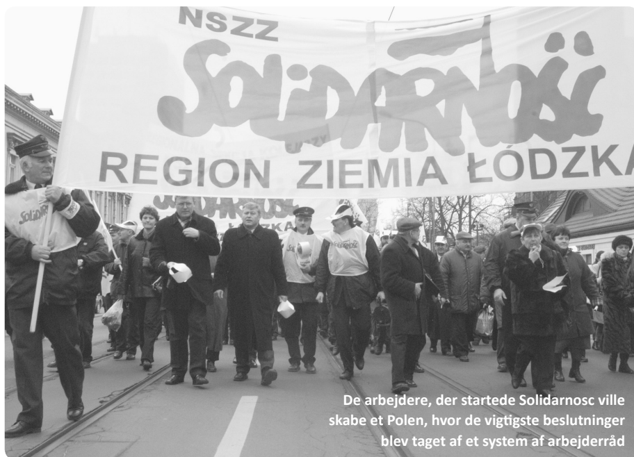
De arbejdere, der startede Solidarnosc ville skabe et Polen, hvor de vigtigste beslutninger blev taget af et system af arbejderråd

» Nu blev det ikke kun de tyske arbejdere, men hele Europa og det meste af verden, der kom til at lide som et resultat af Hitlers magtovertagelse i Tyskland«