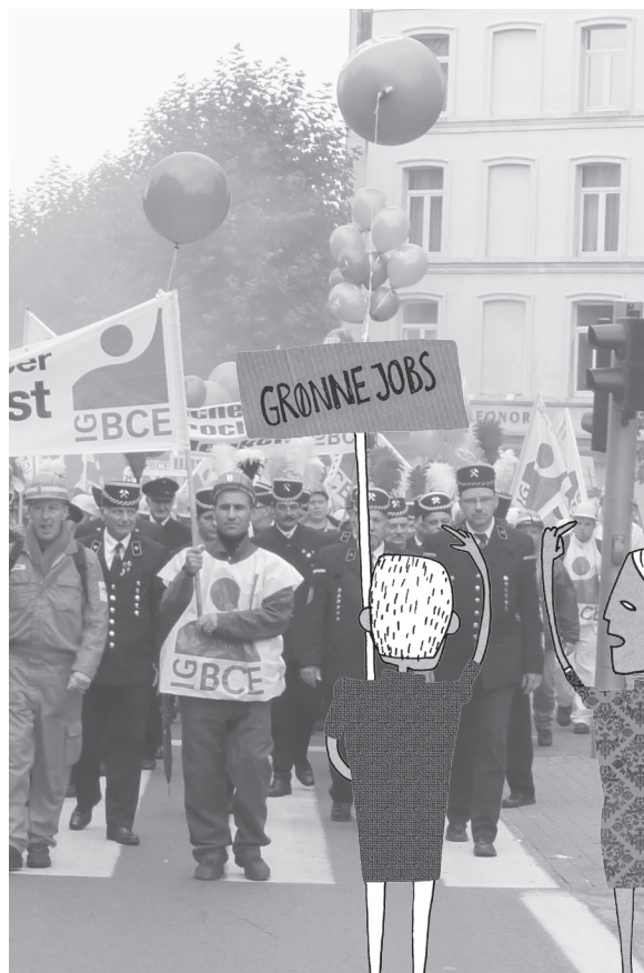
mber 2010.

siel regulering og kontrol med kapitalbevælgelser er vigtigt, men ikke nok.